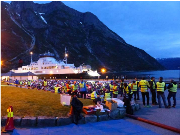
Samstag, 4:00 Uhr Einrichten der Wechselzone