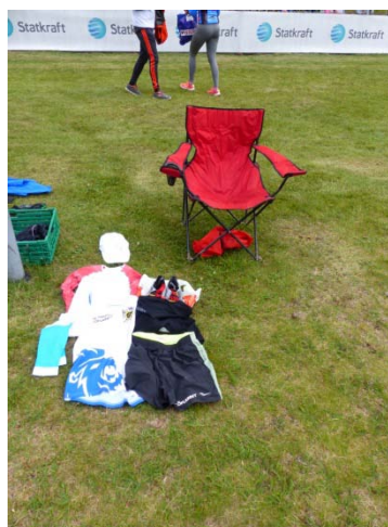
Der Wechsel zum Lauf steht