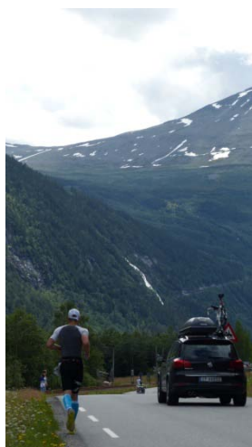
den Aufstieg zum Gaustatoppen vor Augen