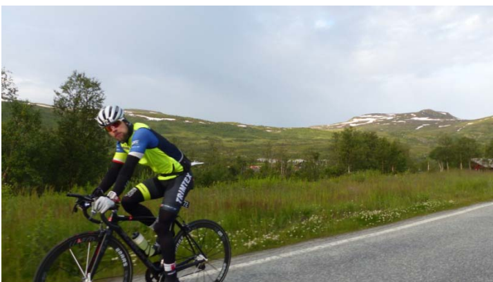
Auf dem Fjell der Hardangervidda vor Geilo