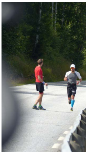
Auf der Laufstrecke