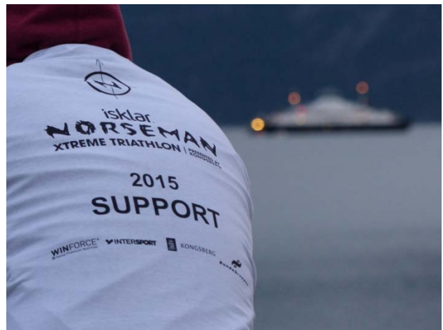
Warten auf die Wettkämpfer