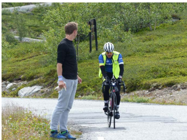
Der letzte Radberg: Imingenfjell