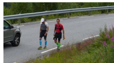
harter Kampf im Zombie-Hill